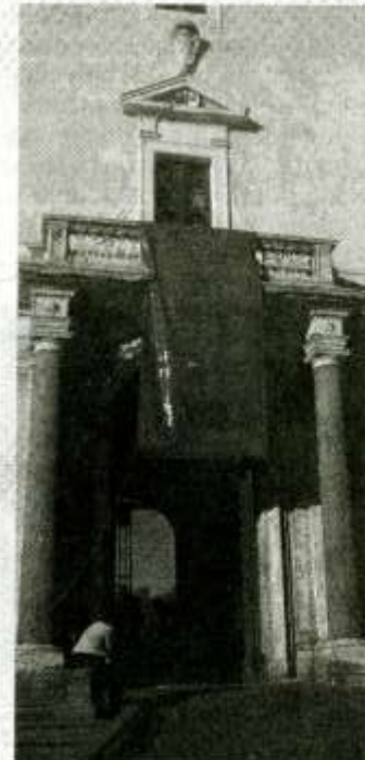
L'incontro il 4 a Palazzo Chigi